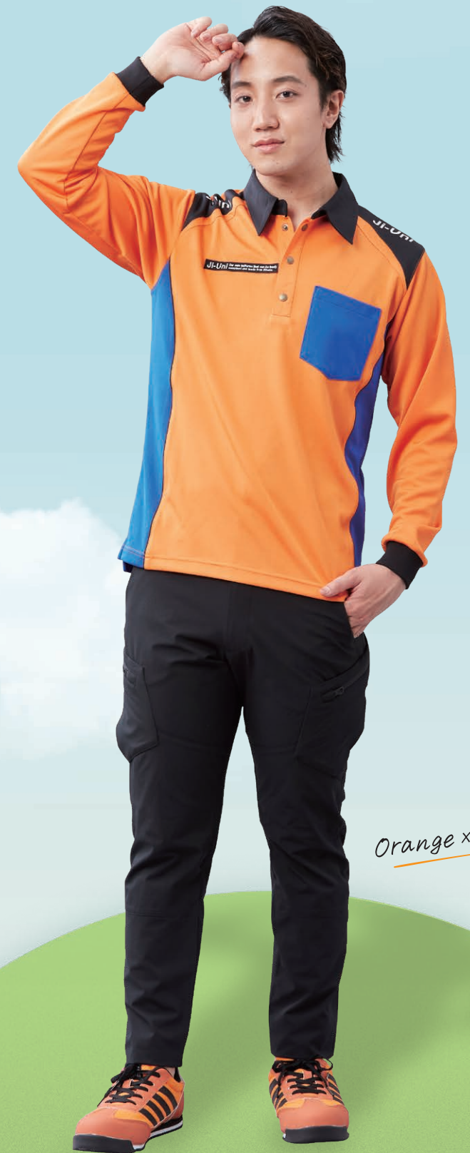
Orange x Blue