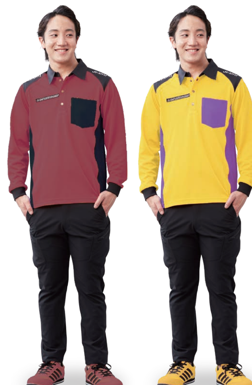
Wine-red x Black