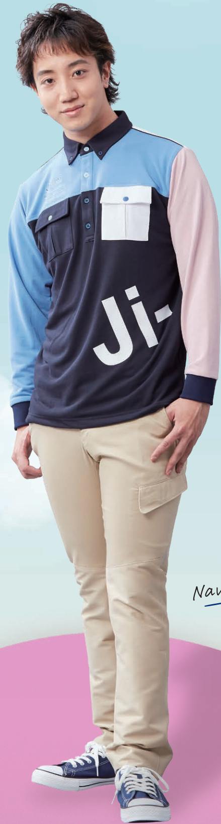
Navy x Pink