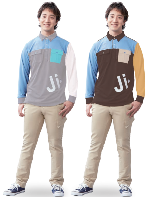
Gray x White