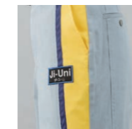
パンツ サイドライン

左袖にペン差しを配置。ペンが1本収まる大きさで作業の妨げにならず、出し入れもラクラクです。