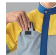
両胸 インポケット

両胸に施されているインポケット。スッキリとしたデザインな上、中身が落ちにくく収納力があります。